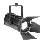
Spotlight Hyperion100 Fresnel WW