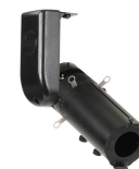
Spotlight Canova Zoomprofil