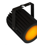
Chroma-Q 2Inspire PoE