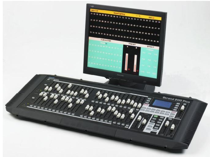
Strand 200plus 24/96

Philips Entertainment stellt mit der aktuellen 200 Plus Serie ein Lichtstellpult mit umfangreichen Features zu einem außergewöhnlich günstigen Preis vor. Ausstattungsmerkmale wie Ethernet, Monitoranschluss, USB-Port, sowie ein integriertes großes LCD-Display heben diese Konsole von vergleichbaren Konkurrenzprodukten ab. Lichtstellpulte der 200 Plus Serie sind für die Regelung von konventionellen Scheinwerfern, LEDs und Moving Lights geeignet. Typische Anwendungsbereiche sind Mehrzweckhallen, Schulen, kleine Theater und Studios.