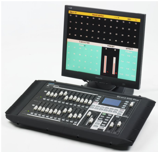
Strand 200plus 12/48