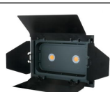
LED Weißlicht Fluter FLT FL1200 3000K 60°