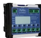
Proplex 8-Track 6 Szenen

Crestron-, AMX- oder KNX-Steuerung über DMX (Dimmer) oder 6 potentialfreie Schaltkontakte (TRigger)