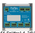
DMX-Splitter 1:4, 24VDC Proplex 1x4 DIN